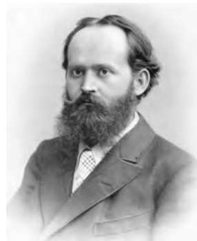
Carl Huter im Jahre 1895, etwa zu der Zeit, als das vorliegende Werk verfasst wurde.

Unsere Adresse im Internet: www.carl-huter.ch